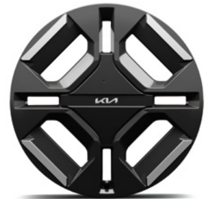
19-Zoll-Leichtmetallfelgen (Serie für GT-line)